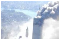
Les photos inédites des attentats du 11 septembre