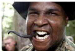
Entraînement de choc chez les Marines

A lire également dans la même rubrique :