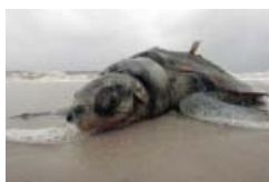
Marée noire en Louisiane

Vous devez vous identifier ou créer un compte pour écrire des commentaires > Signaler un abus