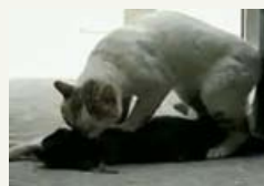
"petite amie" accidentée.

Un chat joue les médecins urgentistes Dans la ville turque d'Antalya, des passants observent un chat qui tente de réanimer sa