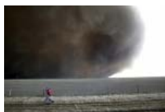
L'Europe sous les cendres