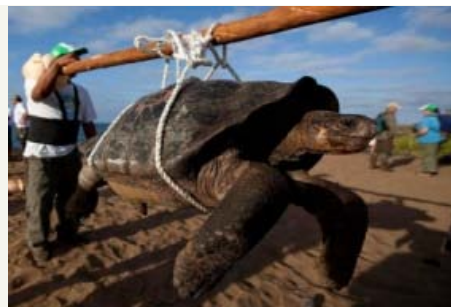
Long!'Rock torride malgré le froid